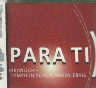
Sechs auf einen Streich – aktuelle CD's zum Nachhören